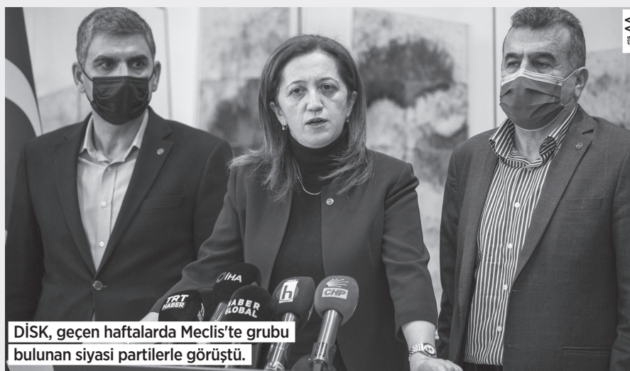
DİSK, geçen haftalarda Meclis'te grubu bulunan siyasi partilerle görüştü.

Devlet 2008 yılından bu yana SGK işveren prim payının 5 puanını bütçeden karşıyor. Bu uygulamanın 2010'dan bu yana bütçeye yükü 147 milyar lirayı aşmış durumda. 2010 yılında 3,8 milyar lira olan 'işverenlere prim desteği', 2020 yılında 25 milyar