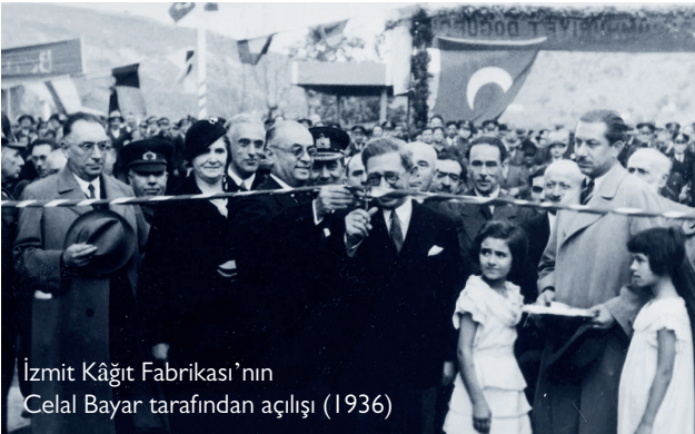
İzmit Kâğıt Fabrikası'nın Celal Bayar tarafından açılışı (1936)

"Selülöz ihalesini oyaladılar, hatta teminatı yakarak selülöz vermediler. Buna karşılık hükümetimiz tütün karşılığı selülöz teslimi şart koştu ve ancak bu baskı zoruyla bir miktar selülöz alabildik. Selülözler işlenmeye başladığında, sabotaj unsuru ortaya çıktı, verdikleri selülöz reçine kusmakta idi. Selülöz hücrelerinden sızan reçine damlacıkları, makinelerin hassas kısımlarına sıvaşıyor ve üretimi engelliyordu. Türk kâğıtçılığını engellemeye çalışanların amacı belli idi. Reçine kusan selülözler yüzünden üretim duracak, olumsuz