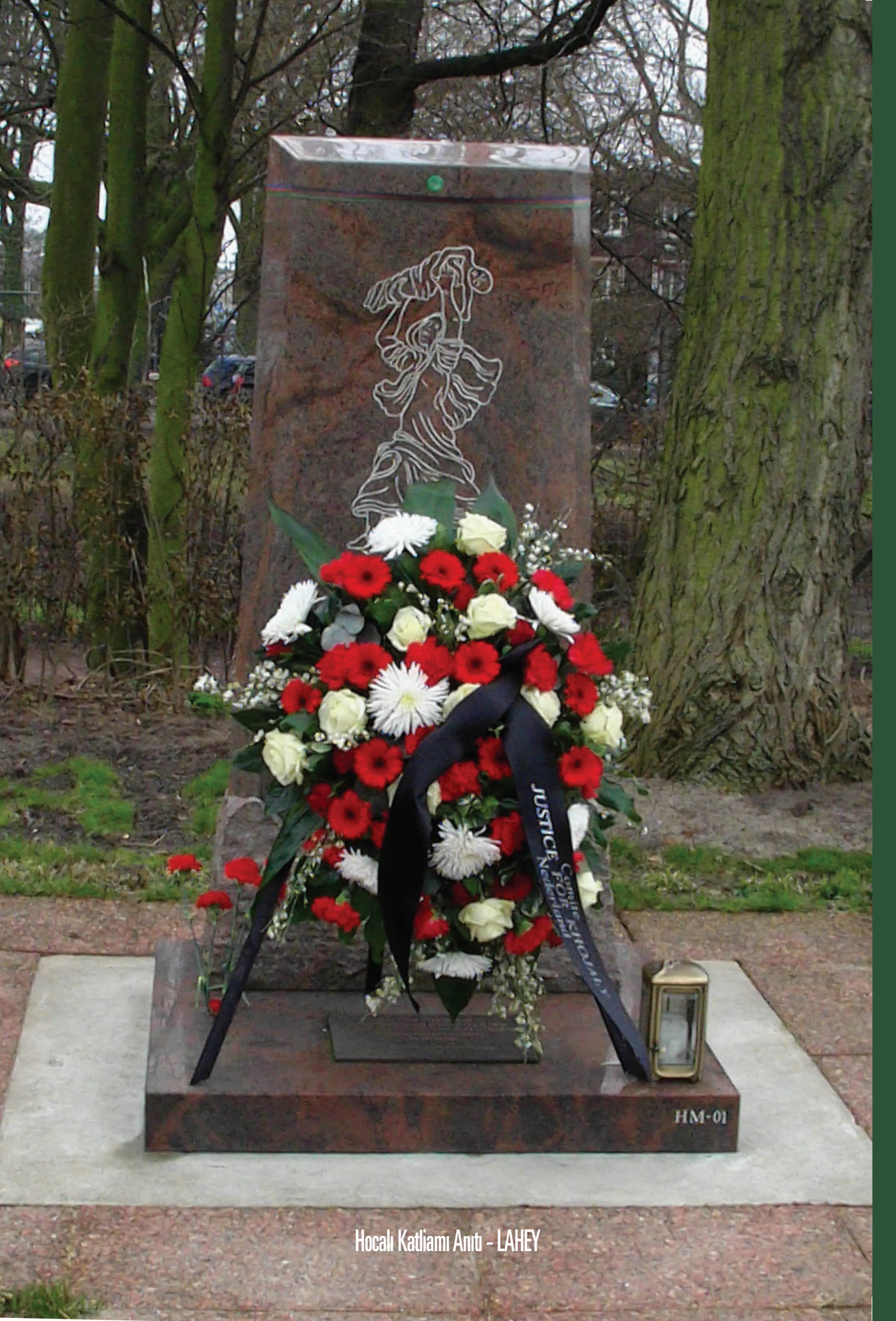
Hocali Katliamı Anıtı - LAHEY