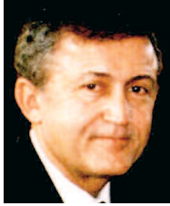
Ahmet Taner Kışlalı

Ülkelerdeki devrimci aydınlarla uğraşma işi, işte bu organizasyonudur. İlerici ve toplumcu her adım ve atılımın öncüleri hedef tahtası farz edilmiştir.