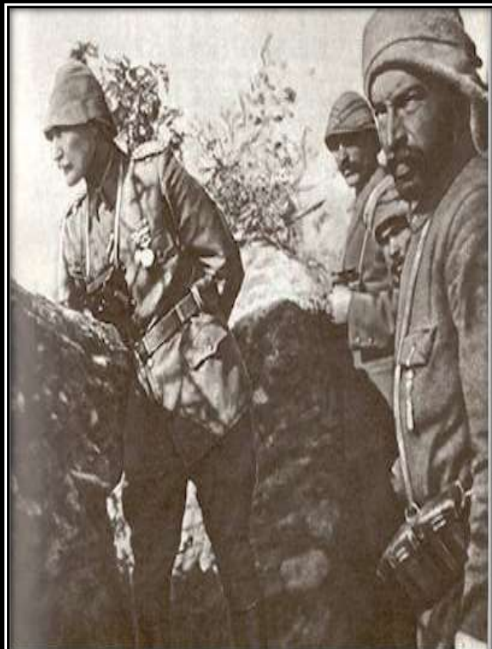
Mustafa Kemal, Çanakkale Savaşı'nda siperde