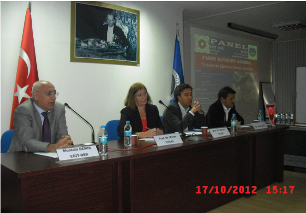
17 Ekim 2012 Fakir Baykurt’u A. Ü. Eğitim Bilimleri Fakültesinde bir etkinlikle andık