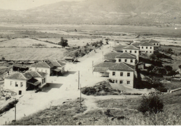
Ortaklar Köy Enstitüsü

Ortaklar Köy Enstitüsü kuruluncaya kadar Aydın, Muğla ve Denizli illerinin öğrencileri İzmir Kızılçullu Köy Enstitüsü'ne gidiyordu. İzmir ve Manisalı öğrencilerle birlikte okuyordu.