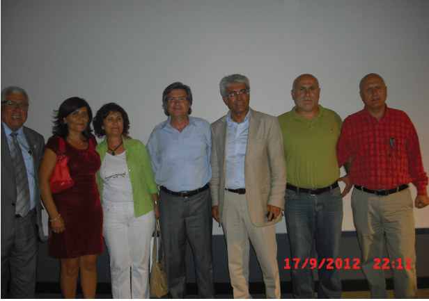
“Toprağın Çocukları” filmi Ankara ön gösterimi