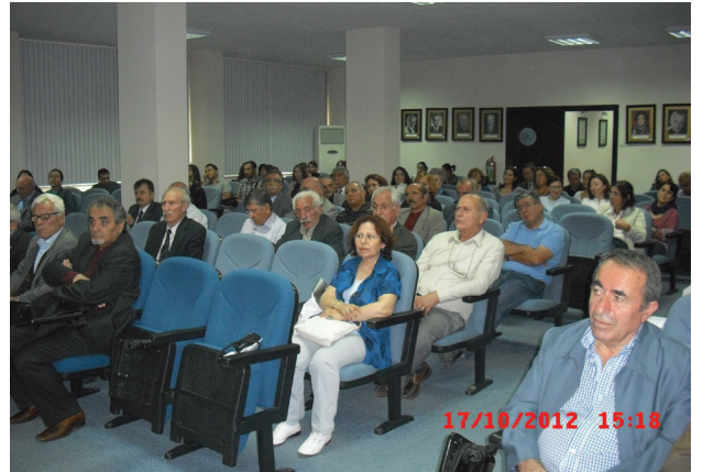
17 Ekim 2012 Fakir Baykurt’u A. Ü. Eğitim Bilimleri Fakültesinde bir etkinlikle andık