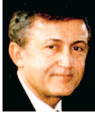
Ahmet Taner Kışlalı

Ülkelerdeki devrimci aydınlarla uğraşma işi, işte bu organizasyonudur. İlerici ve toplumcu her adım ve atılımın öncülleri hedef tahtası farz edilmiştir.