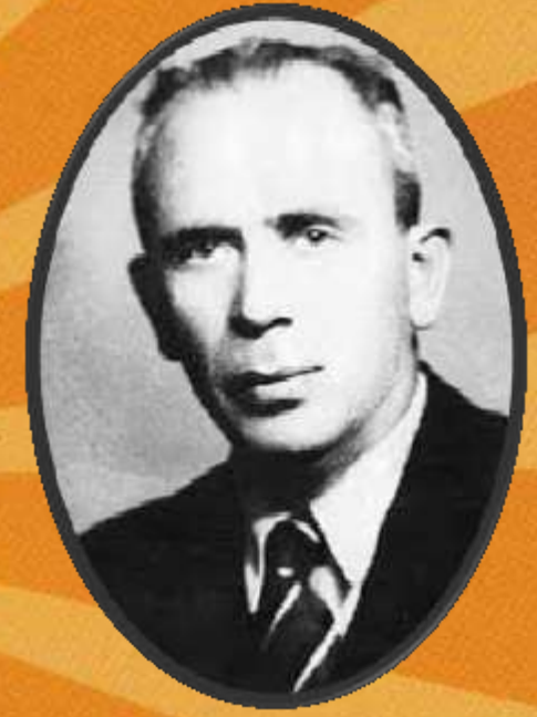
İsmail Hakkı Tonguç İlköğretim Genel Müdürü