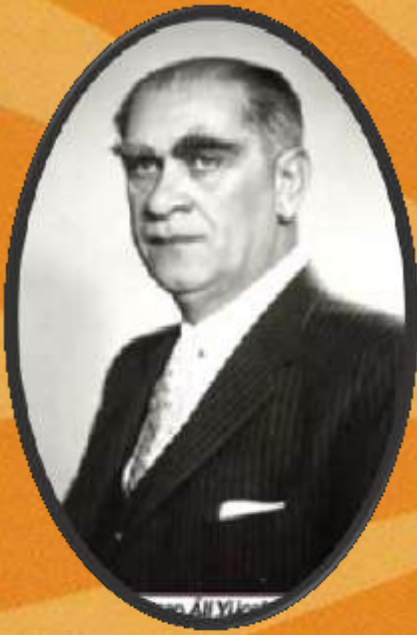
Hasan Ali Yücel Milli Eğitim Bakanı