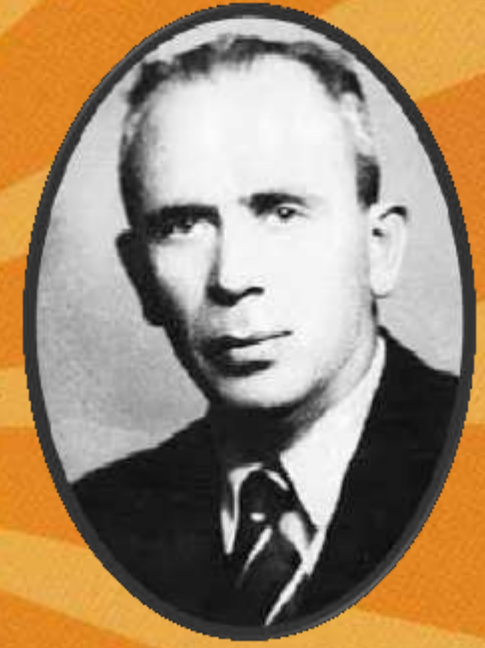
İsmail Hakkı Tonguç İkçğretim Genel Müdürü