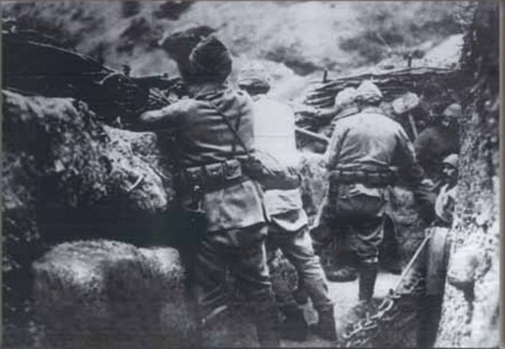
ÇANAKKALE'DE SİPERLERDE DÜŞMANI BEKLEYEN ADRERLERİMİZ