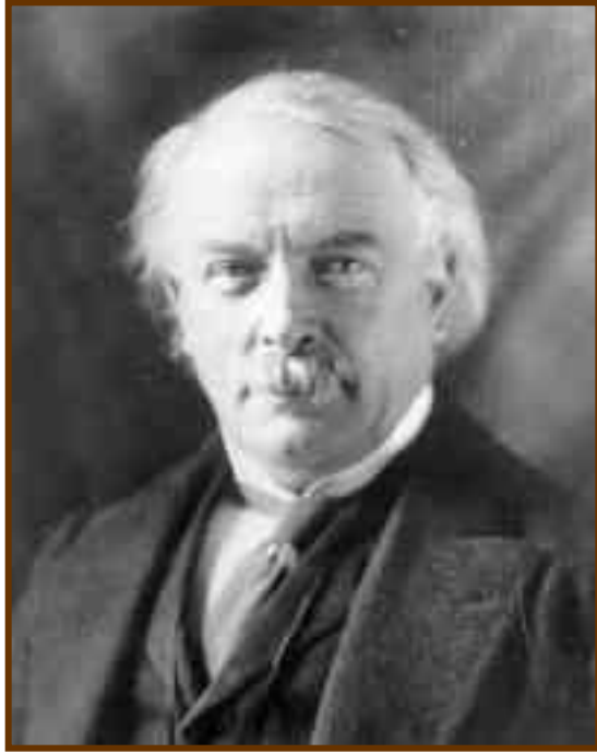
D. Lloyd George İngiltere Başbakanı (1922)

“Yüzyıllar ender olarak dahi yetiştirir.