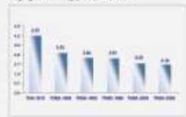
Nüfus ve Sağlık Araştırmalarının Üçüncü Beş Yıllık Ölçümleri İçin Belirli ve Genel Ölçülebilirlikte Eğilimler