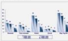
Evlü Kadınların Kullanmakta Oldukları Yöntemlerin İzlenimi