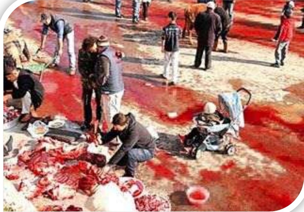
Kurban bayramı, 2011, Türkiye..